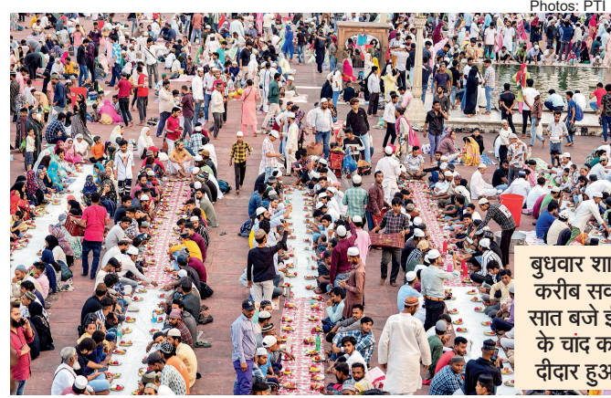
विशेष संवाददाता, नई दिल्ली

आज पूरे देश में ईद मनाई जाएगी। बुधवार को शब्वाल महीने का चांद नजर आ गया है। बुधवार शाम करीब सवा सात बजे ईद के चांद का दीदार हुआ। जामा मस्जिद की चांद कमेटी ने चांद नजर आने का ऐलान किया है। जामा मस्जिद के शाही इमाम ने सभी मस्जिदों के इमामों को सुझाव दिया है कि जहां पूरी तरह से मुस्लिम बस्तियां हैं, वहां नमाजियों की संख्या अधिक होने की वजह से मस्जिद के बाहर नमाज पढ़ सकते हैं। इस दौरान कोई आपत्तिजनक व्यवधान न हो। स्थानीय प्रशासन इसके लिए सहयोग करें। बाहर नमाज पढ़ना मुमकिन न हो तो मस्जिद के परिसर में ही एक से अधिक जमात की जाएं। जामा मस्जिद में सुबह साढ़े छह बजे ईद की नमाज पढ़ी जाएगी।