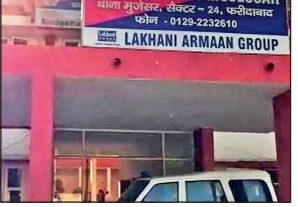
5 अप्रैल को हुई थी चारदात

जीवन नगर में हुई महिला की हत्या के आरोपी को बिहार से गिरफ्तार किया गया है। मुजैसर थाना पुलिस ने मामले का खुलासा किया है। सामने आया कि हत्या के बाद आरोपी शव के साथ ही रातभर रहा। उसने घर में ही खाना बनाया। चारदात के बाद शराब पीता रहा। अब पुलिस मृतका का मोबाइल खोजने में जुटी है। पुलिस प्रवक्ता सुबे सिंह ने बताया कि पांच अप्रैल को पुलिस को सूचना मिली थी कि जीवन नगर के एक मकान से बदबू आ रही है। सूचना मिलते ही संजय कॉलोनी पुलिस चौकी की टीम मौके पर पहुंच गई और कमरे में लगे ताले को तोड़ा। कमरे से एक महिला का शव मिला। गले में चुन्नी लिपटी थी। ऐसे में मकान मालिक की शिकायत पर पुलिस ने मृतका के साथ रहे युवक के खिलाफ हत्या का मामला दर्ज कर जांच शुरू की। मुखबिर की सूचना और मोबाइल लोकेशन के आधार पर संजय कॉलोनी पुलिस चौकी की टीम ने आरोपी को बिहार के फुलकिया से गिरफ्तार किया है।