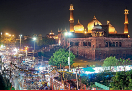
सुबह पढ़ी जाएगी ईद की नमाज

आज पूरे देश में ईद मनाई जाएगी। बुधवार को शब्वाल महीने का चांद नजर आ गया है। बुधवार शाम करीब सवा सात बजे ईद के चांद का दीदार हुआ। जामा मस्जिद की चांद कमेटी ने चांद नजर आने का ऐलान किया है। जामा मस्जिद के शाही इमाम ने सभी मस्जिदों के इमामों को सुझाव दिया है कि जहां पूरी तरह से मुस्लिम बस्तियां हैं, वहां नमाजियों की संख्या अधिक होने की वजह से मस्जिद के बाहर नमाज पढ़ सकते हैं। इस दौरान कोई आपत्तिजनक व्यवधान न हो। स्थानीय प्रशासन इसके लिए सहयोग करें। बाहर नमाज पढ़ना मुमकिन न हो तो मस्जिद के परिसर में ही एक से अधिक जमात की जाएं। जामा मस्जिद में सुबह साढ़े छह बजे ईद की नमाज पढ़ी जाएगी।